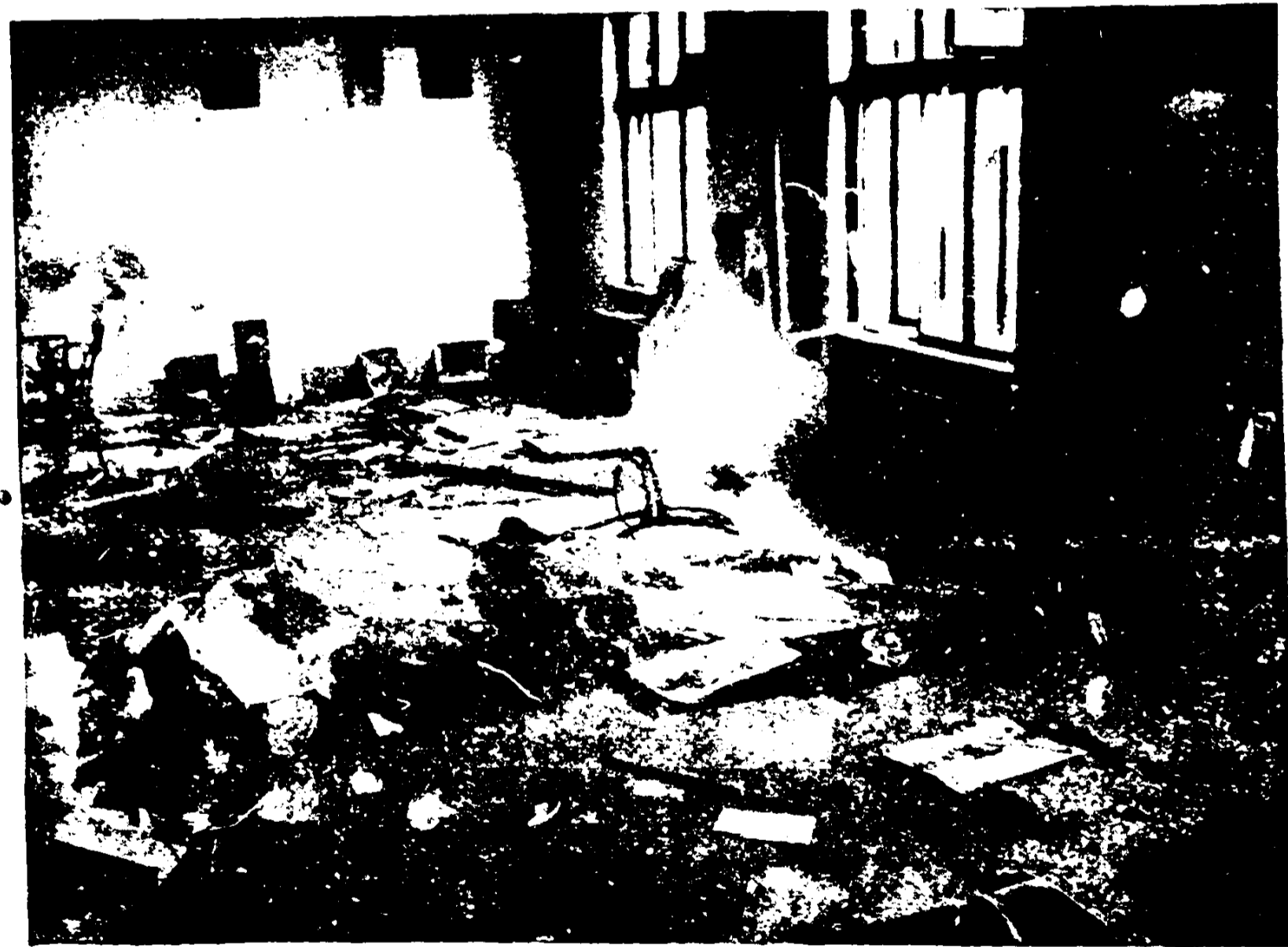
Як виглядає „польська культура“ на українських землях? (Знищена мистецька виставка школи проф. Новаківського у Львові)

В ляхській «тюрмі народів» українське населення не має ні забезпечення життя та майна, ні найпримітивніших людських прав!