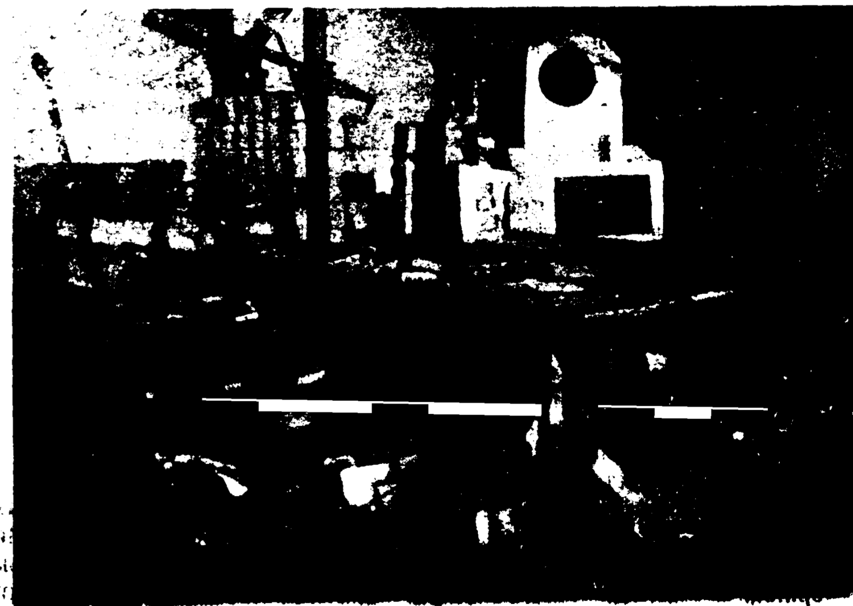
Як ляцький кам нищить музейні старби (Знищена переплетня «Просвіти» з цінними музейними друкками і з «Академічного Дому», уліваючи в підлогу в напрямі цитаделі, там стаціонарне військо, яке обстрілює «Академічний Дім», думаючи, що це студенти вергли в «Академічний Дім» зброю)

— Коли ляцька товпа, під впливом стрідів