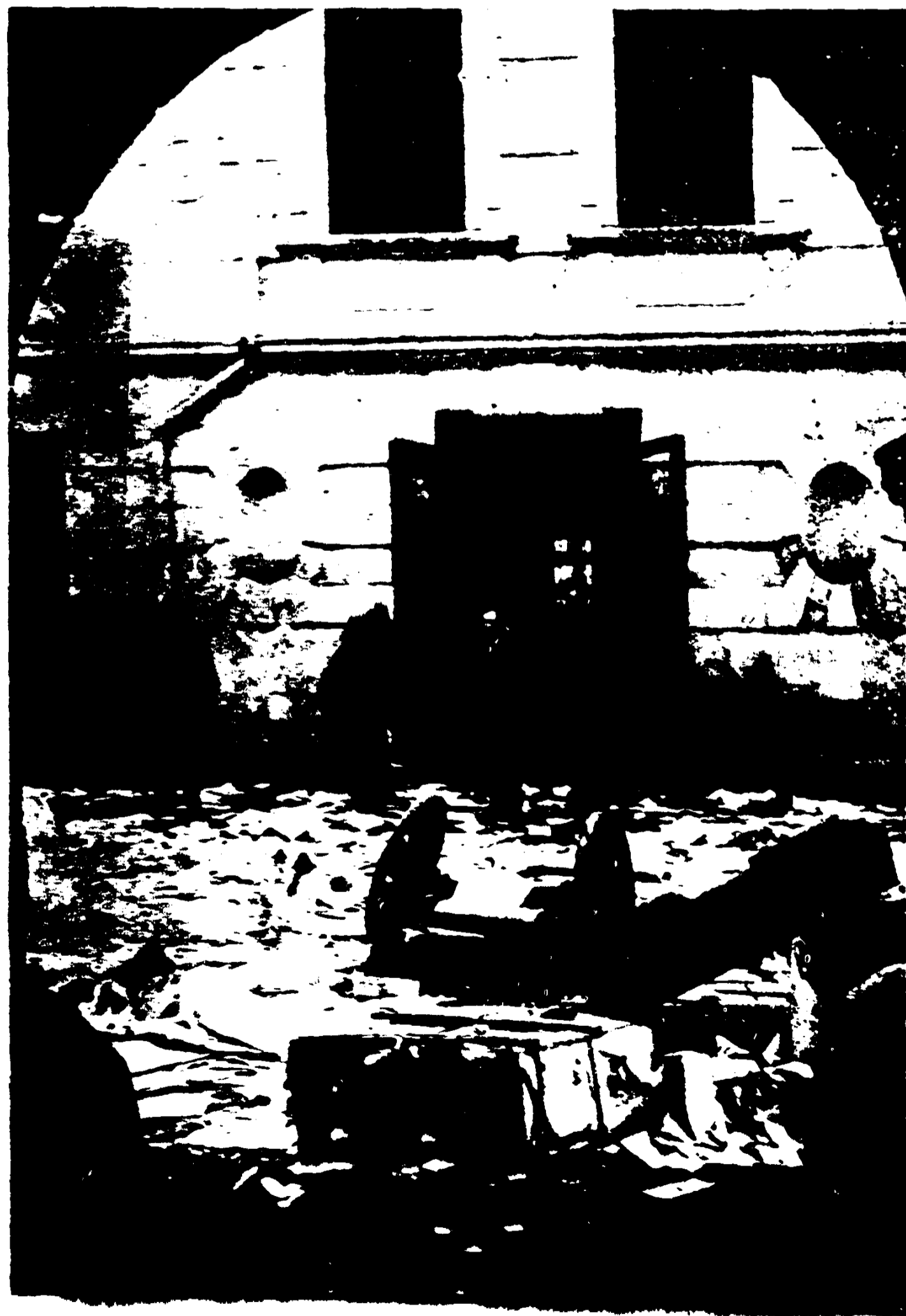
Як личить вандалю господарю на наших землях? (Засмольвання друкарні „Діла“ у Львові)

Ми твердо віримо, що відважна й владарлива Українська Нація, не тільки зуміє героїчно звести на-