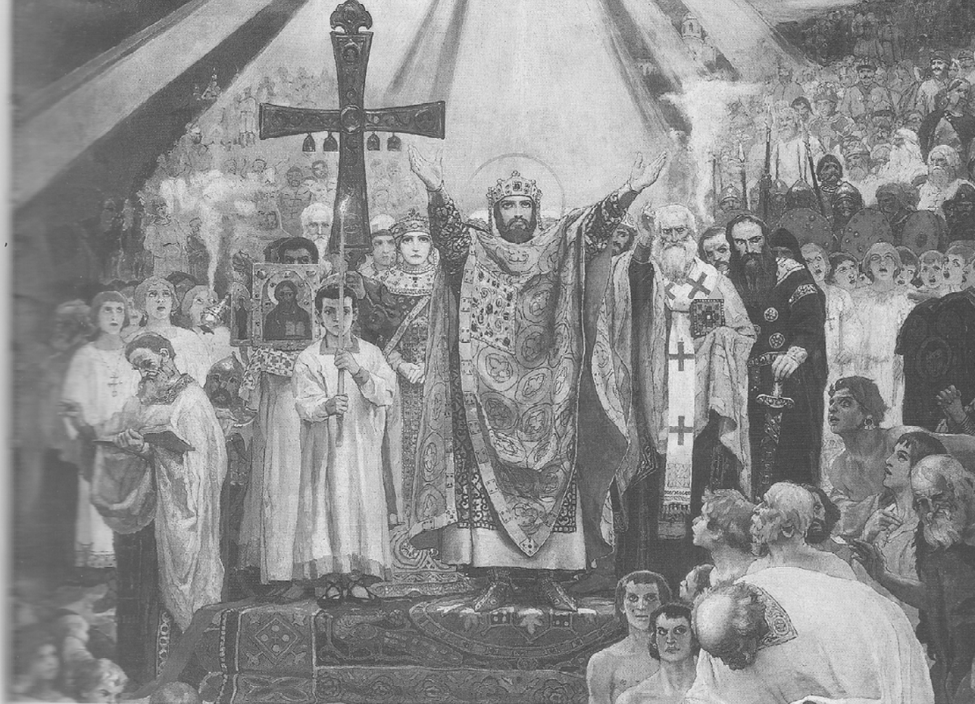
Володимирський собор. Фреска «Хрещення Русі». В. Васнецов

Київ – назва цього величного міста відома багатьом. Вона назавжди золотими літерами записана на скрижалях світової історії. Сучасники називали Київ «вічним», «стольним градом», «матір'ю міст руських». Його коріння сягає глибоких пластів історії людської цивілізації. Це одне з найдавніших міст світу, яке за своє життя пройшло дуже тривалий і важкий шлях від першого поселення кам'яного віку до столиці великої європейської держави – України. У 1982 році урочисто відзначили 1500-річний ювілей Києва, але сучасні учені вважають, що вік міста значно більше.