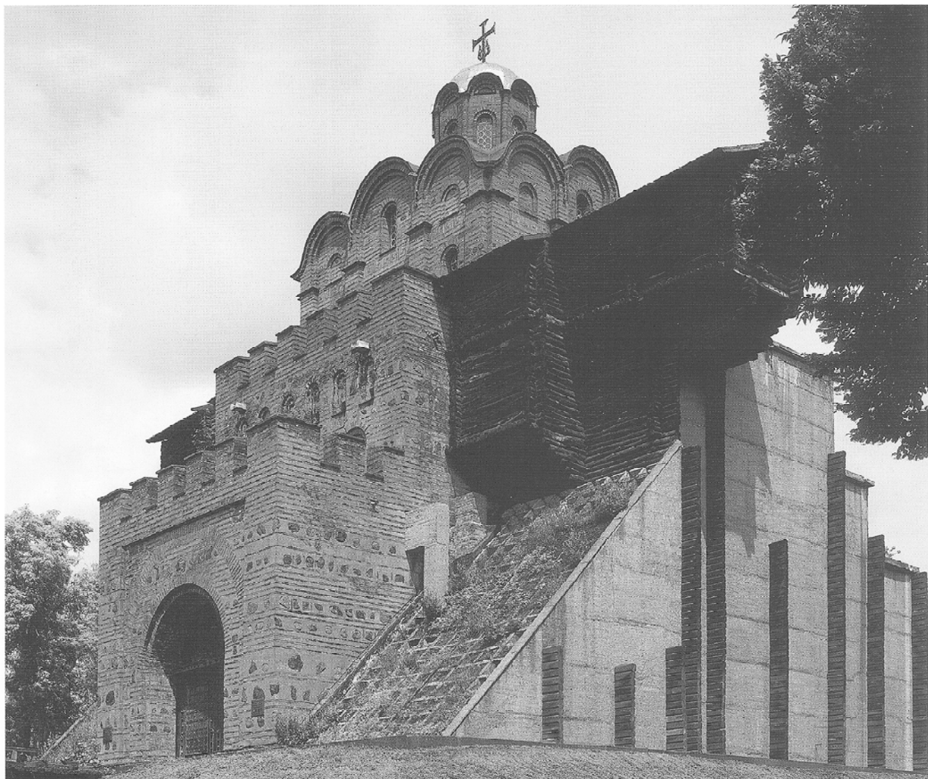
Золоті ворота. XI ст. Реконструкція. 1982

У ще більших масштабах будівництво Києва було продовжене при синові Володимира, Ярославі Мудрому, який княжив з 1019 по 1054 рік. При ньому політична єдність Київської Русі зміцнилася, виріс міжнародний авторитет держави.