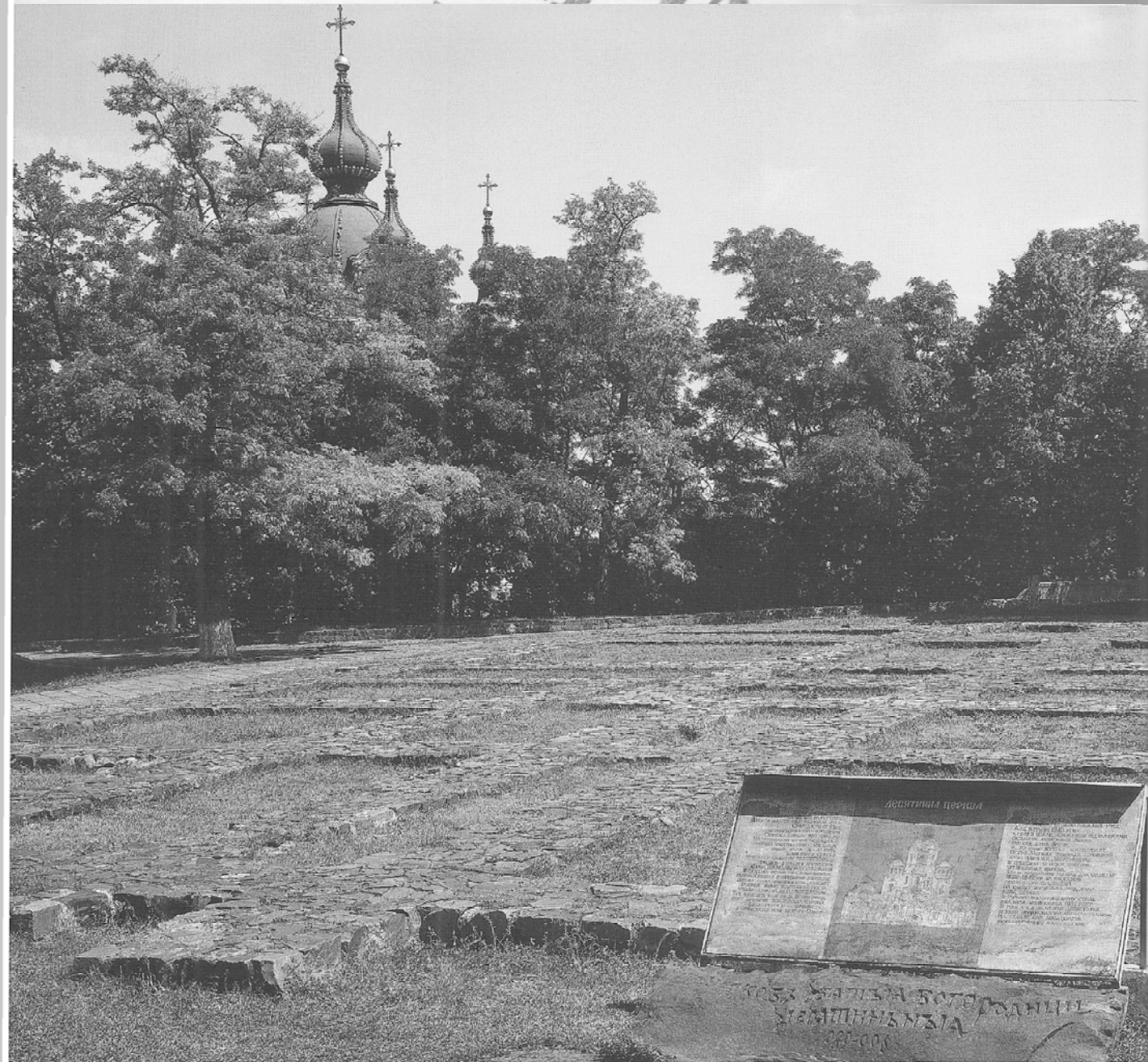
Фрагмент фундаменту Десятинної церкви. X ст.

Літописець Нестор в «Повісті минулих літ» розповів про те, «звідки пішла Руська земля, хто в Києві почав перший княжити». Згідно літопису, місто побудували слов'янські князі племені полян: «І було три брати: одному ім'я Кий, іншому Щек, а третьому Хорив, і сестра їх Либідь. І створили град в ім'я брата свого старшого, і нарекли його ім'ям Київ». Час цієї знаменної події в літописі не вказаний, але учені датують заснування Києва кінцем V століття. При князюванні Володимира Святославича (980 – 1015) Київ став політичним, економічним і духовним центром Київської Русі. У стольному граді побудували сотні церков, головним давньоруським храмом стала Десятинна церква. Сформувався Верхнє місто (Дитинець) і Поділ. Дитинець оточували високий земляний вал і глибокий рів, тут знаходилися прекрасні храми і княжі палаци. Поділ же був заселений ремісниками і торговцями.