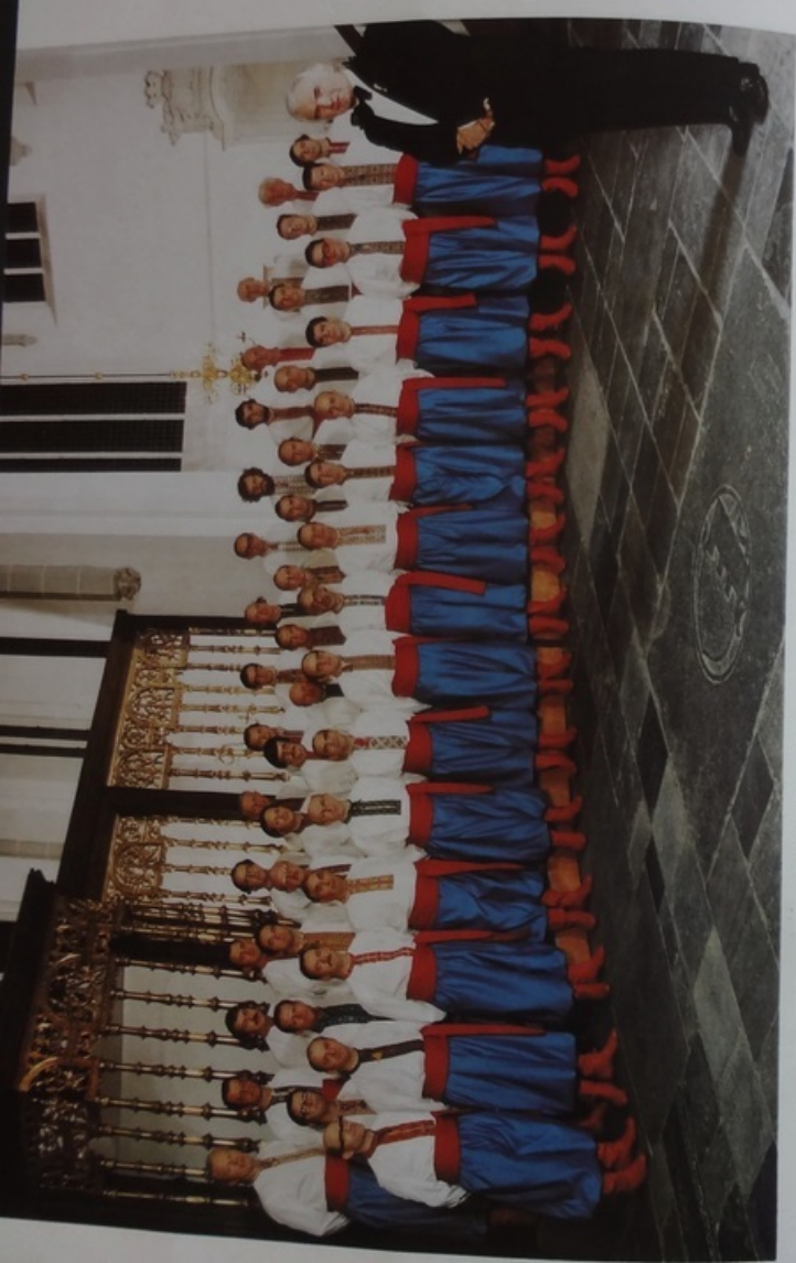
УКРАЇНСЬКИЙ ВІЗАНТІСЬКИЙ ХОР З УТРЕХТУ, ГОЛЛЯНДІЯ