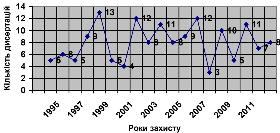
Таблиця 1. Тематична структура дисертаційних робіт з бібліотекознавства