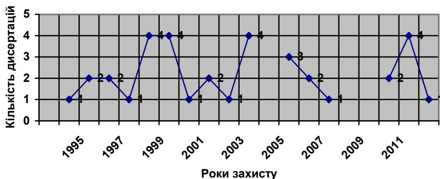
Таблиця 2. Тематична структура дисертаційних робіт з бібліографознавства